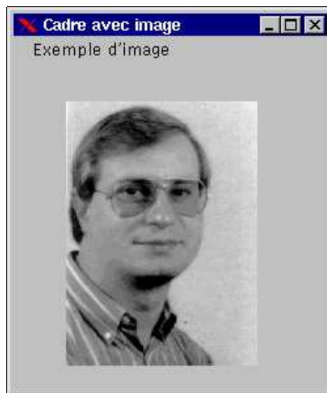
FIG. 5.3 – Affichage d'une image

Écrivons une application Java permettant d'afficher une image se trouvant dans le même répertoire que l'application.