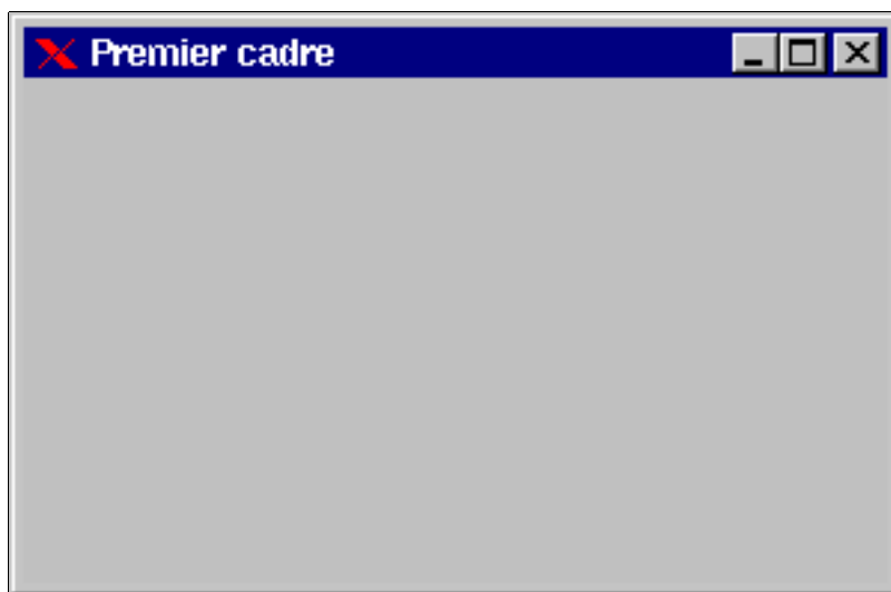
FIG. 5.1 – exemple de cadre

titre de la fenêtre est 'Premier cadre'. On peut utiliser presque toutes les actions habituelles sur un cadre (déplacer, agrandir...), mais on remarquera, par contre, qu'essayer de fermer la fenêtre n'a pas d'action.